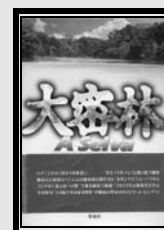
Trad. Japonesa 2001