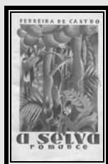
1.ª ed. Port. 1930