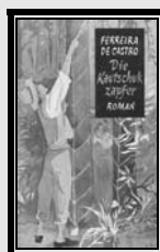
Trad. Alemã 1952