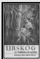
Trad. Sueca 1936