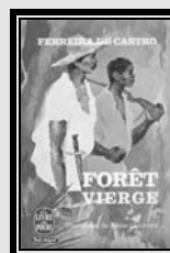
Trad. Franc. 1963