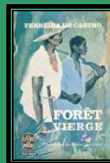
Trad. Franc. 1963