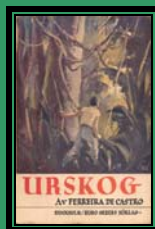
Trad. Sueca 1936