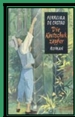
Trad. Alemã 1952