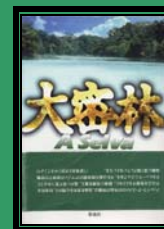
Trad. Japonesa 2001