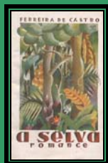
1.ª ed. Port. 1930